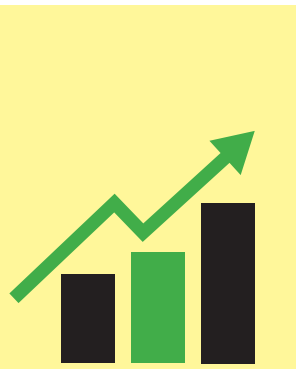
الإجمالي من إيرادات الشركة في الربع الثاني من 2022 مقارنة بالفترة المماثلة من 2021

يأتي القرار في ظل سعي وزارة التجارة والصناعة لتصبح شركة "جسور" نواعا لها لتحقيق خطة الدولة الرامية لزيادة قيمة الصادرات المصرية، من خلال التنسيق بين جهات الدولة وكيانات القطاع الخاص المعنية بتنمية الصادرات، على أن تواصل شركة "جسور" اختصاصاتها في القيام بأعمال وخدمات السياحة، والتسويق، والنقل، والخدمات