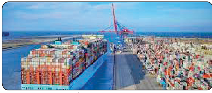
مصر تمتلك 18 ميناء تجارياً ولديها 3 آلاف كيلو متراً شواطئاً .. والدولة تنفذ خطة تطوير للموانئ بشكل كامل لجذب الاستثمار

تقوم وزارة النقل في الوقت الحالي بتنفيذ خطة شاملة لتطوير منظومة النقل البحري تشمل تطوير الموانئ وجذب مشغلين وخطوط ملاحية عالية واستعادة قوة الأسطول التجاري المصري وزيادة طاقة التداول وتقليل زمن الأرباح الجمركي.